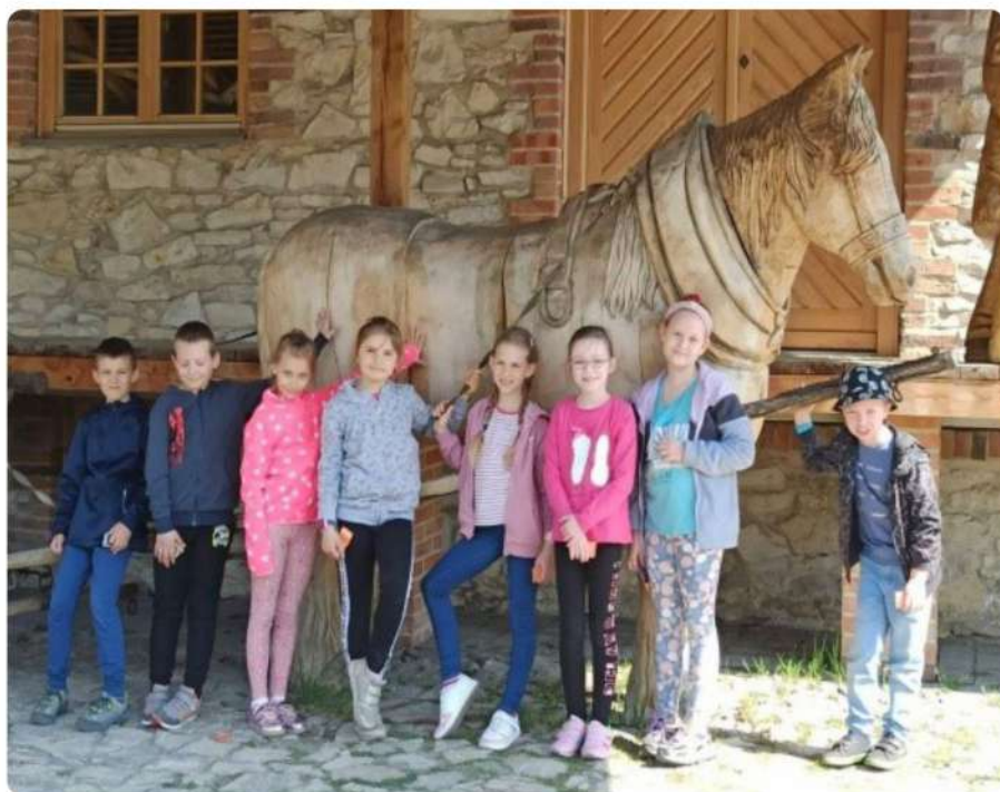
Od dziecięcych lat z ekologią za Pan brat!

„Wiedzą dzieci, że najważniejsza jest segregacja śmieci”, „Niszczymy las, nie będzie nas”, „O powietrze dbamy, czystym oddychamy” – to tylko niektóre hasła związane z ochroną środowiska, które nie są obce trzecioklasistom ze Szkoły Podstawowej w Rudnikach. Naszym podstawowym celem jest umożliwienie uczniom zdobycie wiedzy z zakresu ekologii poprzez rozbudzenie ich aktywności w kierunku poznania i zrozumienia świata. Od lat w naszej szkole włączamy uczniów do różnorodnych działań z tego zakresu. Te działania to m.in. warsztaty, wycieczki, konkursy, zbiórki, imprezy plenerowe i akcje. Powinniśmy również pamiętać, że dzieci lubią naśladować dorosłych. A